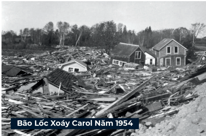
Bão Lốc Xoáy Carol Năm 1954

Năm 1954, Bão Lốc Xoáy Cấp 3 Carol với những cơn gió dữ dội 135 dặm/giờ đã khiến 68 người tử vong và gây thiệt hại $461 triệu.*