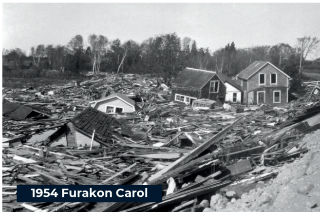
1954 Furakon Carol

Furakon Carol, di katiguria 3, ku rajadas di bentu di 135 mph, kauza 68 mortis i $461 million na danus na 1954.*