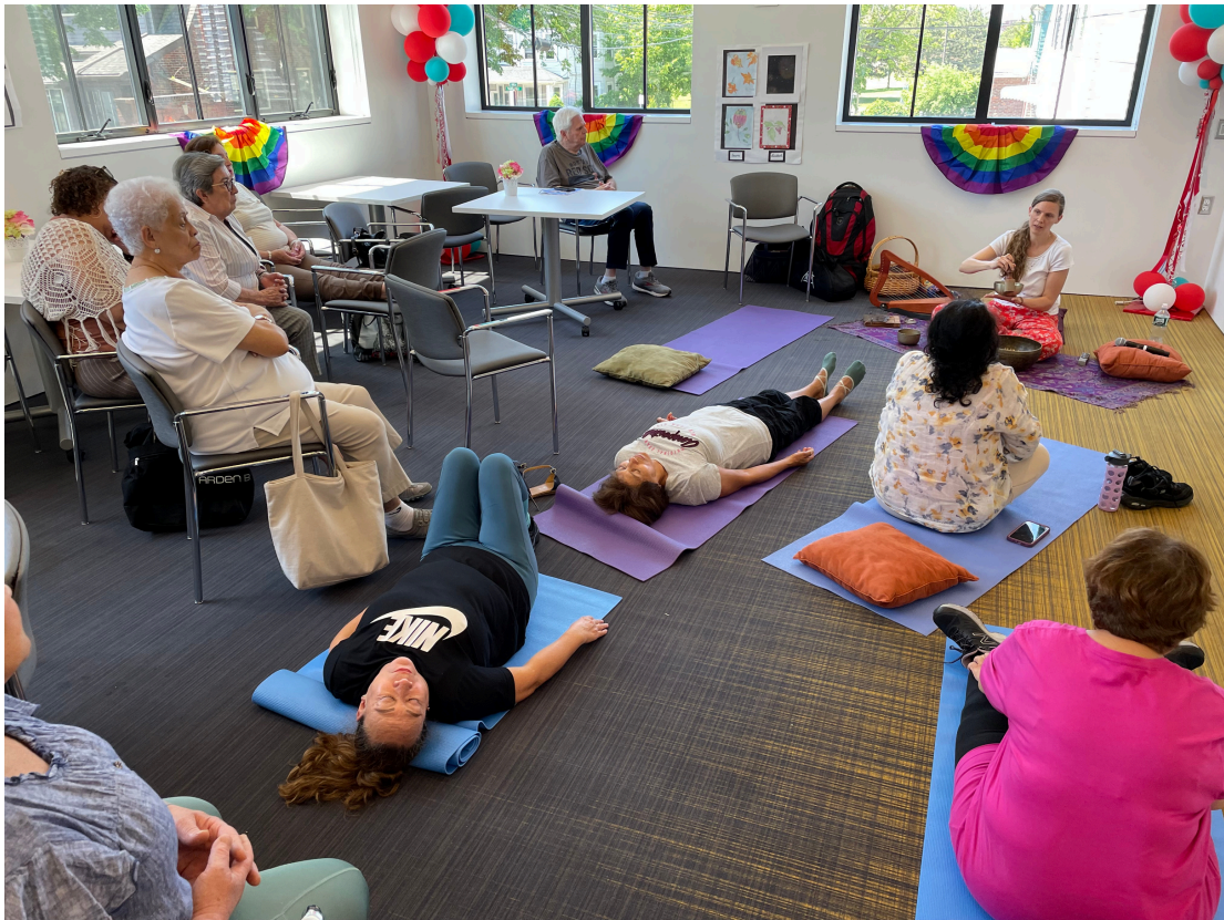
Sound Meditation with Song of the Threes