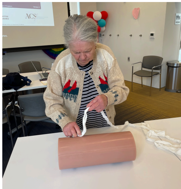
Stop the bleed with Brigham and Women's Hospital