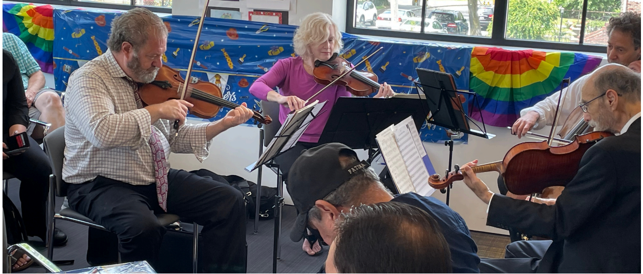
Boston Landmarks Orchestra

For more information, visit / Para obtener más información, visite: boston.gov/municipal-buildings/east-boston-senior-center